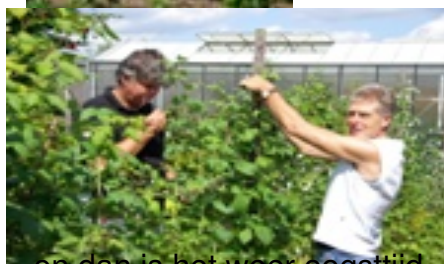
en dan is het weer oogsttijd