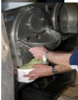
Samen zuurkool maken ... mmmmmmm