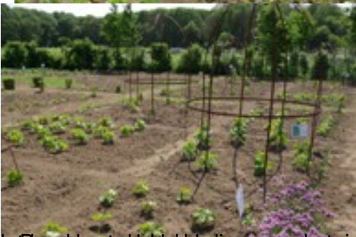
Daarna de bereiking van de tuin