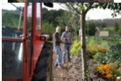
Gezellig even bijkletsen en ook nog de frambozen opbinden