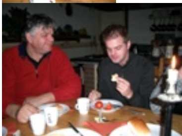
Samen gezellig uit eten gaan. Elk jaar houden we een leuk uitstapje met alle vrijwilligers