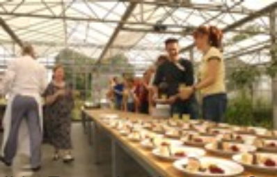
op het Foto van de groente Groentep in de tuin van de groentep eigenijk een feest