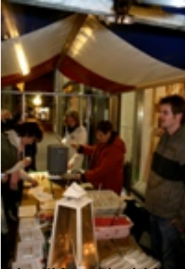
Verdikt met brokjes van tijdens