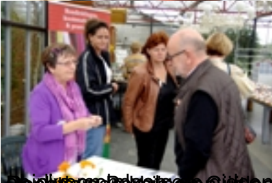
Bezoekers bij de Gipsgroep en de groep met de tent in Amsterdam Museumnacht in Rotterdam