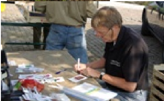
in de vroege ochtend om te helpen bij de ritje te maken