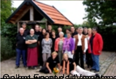
Volksfeest in de Vrijwilligers Groenten