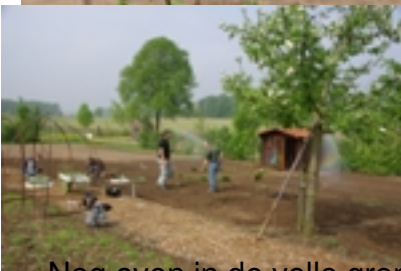
Nog even in de volle grond zaaien...